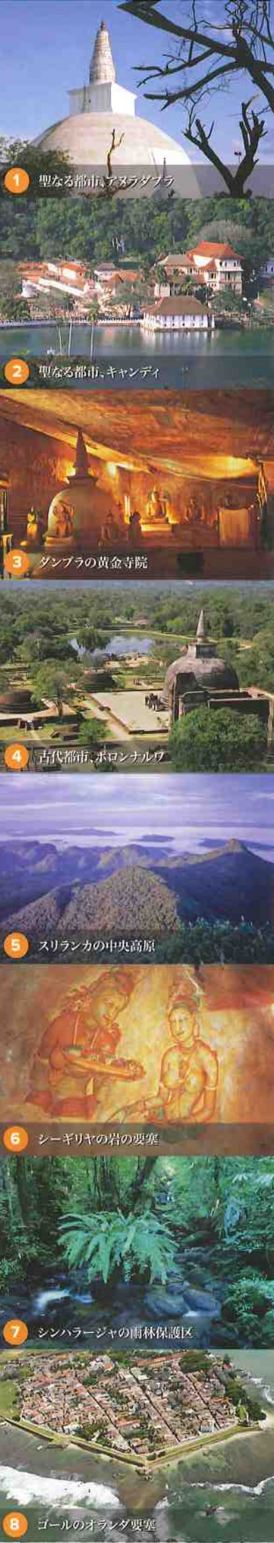
1 聖なる都市、アスラダブラ